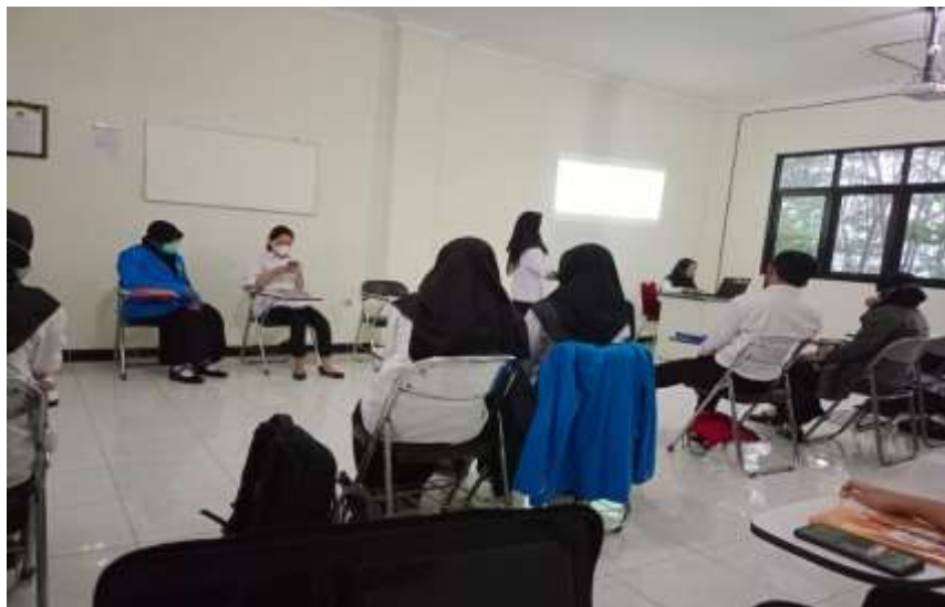
Gambar3. Pemaparan Hasil Penyusunan Evaluasi Pendidikan Karakter

Pada Gambar 2 tim pengabdian melaksanakan pengenalan konsep terkait Pendidikan karakter yang meliputi definisi, tujuan dan urgensi. Selain itu ada pula penyampaian nilai-nilai karkater yang mana mahasiswa untuk mengidentifikasi dari masing-masing nilai Pendidikan karakter tersebut. Adapun kegiatan selanjutnya yaitu dapat dilihat pada Gambar 3.