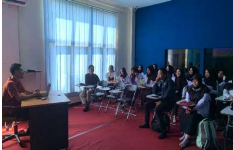
Gambar 2. Edukasi tentang Pendidikan Karakter

Pada Gambar 2 tim pengabdian melaksanakan pengenalan konsep terkait Pendidikan karakter yang meliputi definisi, tujuan dan urgensi. Selain itu ada pula penyampaian nilai-nilai karkater yang mana mahasiswa untuk mengidentifikasi dari masing-masing nilai Pendidikan karakter tersebut. Adapun kegiatan selanjutnya yaitu dapat dilihat pada Gambar 3.