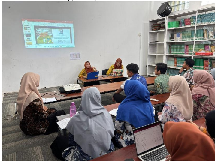
Gambar 1.1 Pelatihan yang di lakukan di MA-Albidayah

Pelatihan penggunaan media Augmented Reality (AR) bagi guru matematika MA Al-Bidayah dilaksanakan selama 3 sesi pelatihan dengan total durasi 12 jam. Pelatihan meliputi pengenalan konsep AR, praktik penggunaan aplikasi AR untuk materi matematika, penyusunan RPP berbasis AR, serta simulasi pembelajaran di kelas. Seluruh peserta mengikuti pelatihan secara penuh dan aktif terlibat dalam kegiatan praktik.