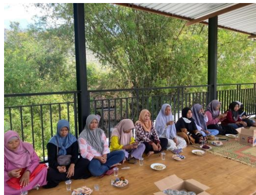
Gambar 2. Penyuluhan TOGA (Sumber: Dokumentasi penelitian, 2024)

Dalam pelaksanaan pengabdian ini, diawali dengan menyusun materi yang akan digunakan sebagai materi penyuluhan TOGA. Penyuluhan ini dilaksanakan sebanyak 2 kali yaitu di tanggal Juli 2024 dan Agustus 2024. Peserta dari penyuluhan adalah 2 orang perwakilan PKK RT. Total RT di Desa Ngerangan adalah 32 RT sehingga total peserta adalah 64 orang. Penyuluhan pertama dilakukan penyuluhan mengenai pentingnya taman TOGA dan tanaman-tanaman yang dapat ditanam sebagai TOGA. Penyuluhan kedua adalah saat revitalisasi TOGA sudah selesai dilaksanakan. Penyuluhan ini memberikan informasi bagaimana cara menanam TOGA serta inovasi yang dibarengkan dengan taman TOGA yaitu warung hidup yang ditana dengan cara hidroponik. Saat penyuluhan kedua, juga diberikan informasi bahwa akan diadakannya lomba membuat taman TOGA antar RT Desa Ngerangan.