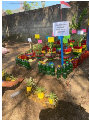
Gambar 4. Hasil Karya Perlombaan TOGA antar RT

Kegiatan penyuluhan dan revitalisasi taman TOGA diakhiri dengan perlombaan antar RT Desa Ngerangan. Perlombaan ini dilakukan dengan tujuan untuk memotivasi tiap RT untuk bersemangat dalam membuat taman TOGA sekaligus menyambut hari kemerdekaan Republik Indonesia yang ke 79. Perlombaan ini dilaksanakan di joglo atau homestay milik desa dan lahan yang digunakan untuk perlombaan disediakan oleh desa dengan lahan sebesar 40m x 2m yang dibagi rata. Jadi, setiap RT memiliki lahan 2m x 1,25m. kegiatan perlombaan ini dilakukan selama 3 hari yaitu senin, 12 Agustus 2024 pukul 08.00 WIB dan pengumuman hari rabu, 14 Agustus 2024.