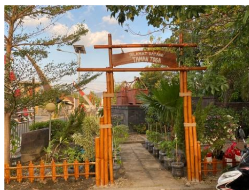
Gambar 3. Hasil Revitalisasi Taman TOGA

Saat masa penyusunan materi untuk penyuluhan hingga pelaksanaan penyuluhan kedua, dibarengi juga dengan revitalisasi taman TOGA. Revitalisasi ini bertempat di Gallery (pusat kegiatan Desa Ngerangan). Pemilihan lokasi ini dikarenakan lokasi ini sebelumnya sudah ad ataman TOGA tetapi tidak terawat dengan baik, dan lokasi ini berada di pinggir jalan dan sebagai pusat kegiatan Desa Ngerangan. Jadi, lokasi ini dianggap strategis dan seluruh masyarakat dapat melihat serta merawat taman TOGA nantinya. Revitalisasi taman TOGA ini membutuhkan waktu 3 minggu dari proses pembelian bibit hingga siap dipamerkan saat penyuluhan kedua. TOGA dan warung hidup yang ditanam adalah pandan, sereh, kencur, jahe, kumis kucing, lidah buaya, kunyit, kemangi, terong, selada, seledri, cabai, jeruk purut, sawi, dan pokcoy.