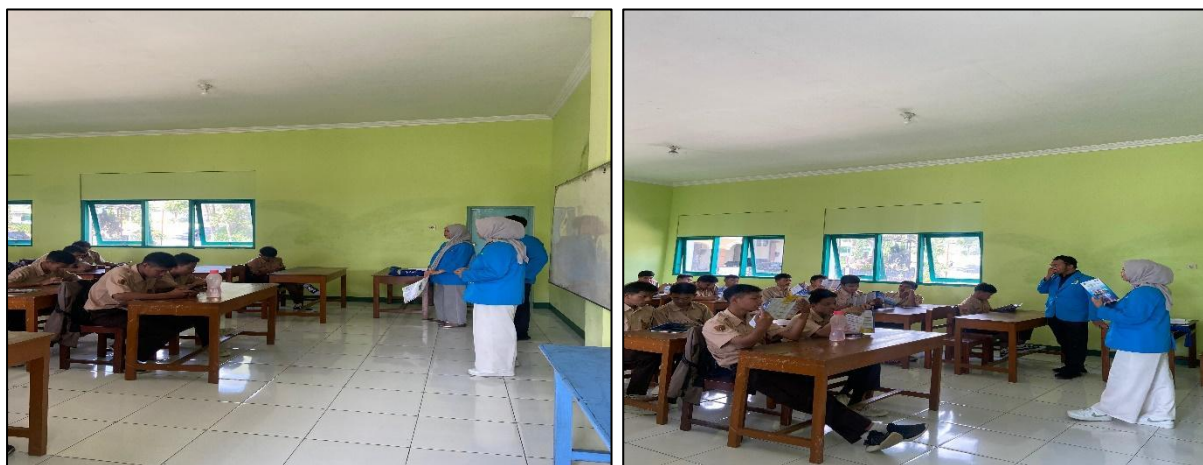
Gambar : Pemberian materi oleh pemateri

Belajar dapat digunakan untuk mengembangkan dan mengasah berbagai keterampilan, termasuk kemampuan untuk memecahkan masalah, berpikir optimis, berkomunikasi secara efektif, menjaga kondisi tubuh tetap bugar, bersikap asertif, percaya diri dan menghargai diri sendiri, serta mengelola stres. Oleh karena itu, remaja dari semua latar belakang dan tahap perkembangan membutuhkan akses terhadap pendidikan kesehatan reproduksi sejak dini. Berikut ini adalah rekaman kegiatan pendidikan kesehatan reproduksi remaja dan sosialisasi pernikahan dini yang berlangsung di Smk Tarunatama.