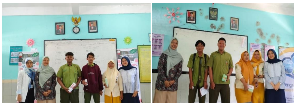
Gambar 5. Pemberian doorprice bagi peserta Pengabdian kepada Masyarakat

Kegiatan pengabdian masyarakat dengan tema Softskills Pharmapreneur dan Pencegahan Bullying yang telah dilaksanakan di SMA Muhammadiyah Gubug telah berhasil dilaksanakan dengan baik. Tingkat pemahaman dan edukasi dari semua peserta meningkat signifikan setelah pemaparan materi diberikan. Hasil yang signifikan dapat terlihat dari persen kenaikan hasil evaluasi masing-masing peserta. Rata-rata kenaikan pemahaman pada masing-masing materi sebesar 15.74% untuk Materi I, 20,67% untuk Materi II, dan 20.61% untuk materi III.