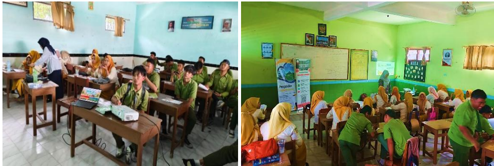
Gambar 3. Pelaksanaan prites dengan peserta Pengabdian kepada Masyarakat