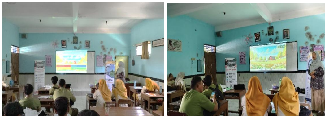
Gambar 2. Perkenalan dan sosialisasi awal kegiatan Pengabdian Kepada Masyarakat

Pre-test dan sosialisasi dilakukan secara serempak untuk seluruh siswa kelas XII, baik dari jurusan Ilmu Alam maupun Ilmu Sosial, sebagai bentuk pengukuran awal sebelum penyampaian materi dimulai. Melalui keterlibatan aktif guru dan siswa, kegiatan ini bertujuan membekali siswa tidak hanya dengan keterampilan kewirausahaan di bidang farmasi, tetapi juga kesadaran dan kemampuan dalam mencegah serta menghadapi bullying , sehingga tercipta lingkungan sekolah yang lebih sehat, suportif, serta meningkatkan softskills bagi peserta didik di SMA Muhammadiyah Gubug.