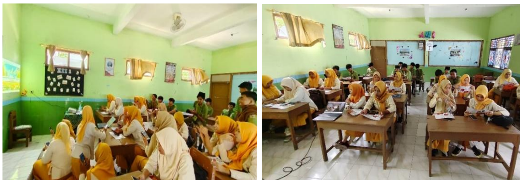
Gambar 4. Pemaparan materi dan pelatihan bersama tim Pengabdian kepada Masyarakat

Kegiatan softskills pharmapreneur dan pencegahan bullying ini dilaksanakan pada melalui tahapan pre test, penyampaian materi, post test serta evaluasi hasil. Sebelum pretes dimulai, pemateri melakukan pendekatan dengan perkenalan kepada pelajar sekaligus menyampaikan maksud dan tujuan kegiatan ini. Sosialisasi dan pretes SMA Muhammadiyah Gubug dilaksanakan sesuai dengan pembagian kelompok siswa kelas XII. Pelaksanaan sosialisasi dan prites serempak dilakukan terhadap seluruh peserta dan juga Guru Pendamping sebagai evaluasi pemahaman awal materi yang akan disampaikan oleh Tim Pengabdian kepada Masyarakat.